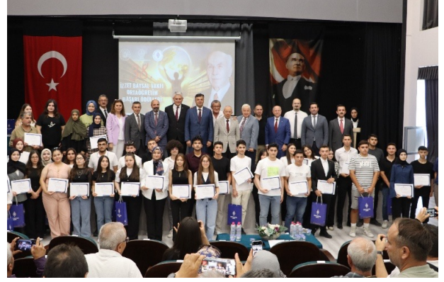
Vakfımız tarafından Bolu Merkez ve İlçelerinde bulunan Liseleri 1.sıra ile tamamlayan mezunlara verilen ödül sonrası çekilen hatıra fotoğrafı.