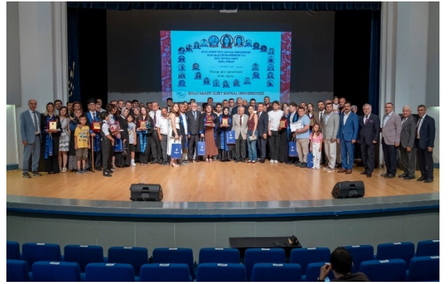
Bolu Abant İzzet Baysal Üniversitesini derece ile bitiren mezunların ödüllendirildiği törenin ardından yansıyan fotoğraf karesi.